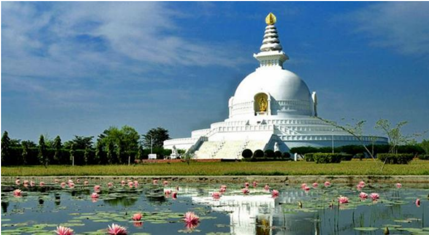
Ngôi tháp và hồ nước tại Vườn Lâm Tỳ Ni (Lumbini) tại Nepal nơi Đức Phật đã đản sinh

đời của Ngài: Bồ Tát Hộ Minh từ cung trời Đâu Suất (Cho hay Bồ tát hậu thân) đản sinh vào dòng họ Thích Ca, lớn lên trong hoàng cung (U ơ tiếng trẻ, êm đềm Vương cung), vượt thành đi xuất gia vào đêm khuya thanh vắng, sáu năm tầm đạo và tu khổ hạnh nơi rừng già (Tuyết sơn phát ngọn trắng già), thiền tọa 49 ngày đêm dưới gốc cây Bồ Đề và thành tựu đại giác ngộ và đại giải thoát vào lúc sao mai vừa mọc (Nhìn sao mà ngộ sự tình/Ai người Đại Giác cho mình quy y), 45 năm vân du giáo hóa chúng sinh để “nâng cội thế qua bùn tử sinh.”