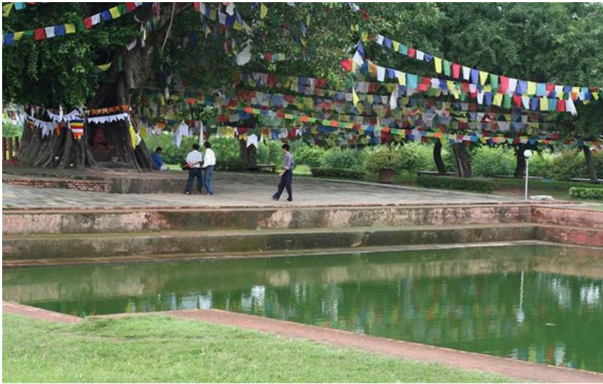
Hồ nước sát cây Hoa Vô Ưu nơi Hoàng Hậu Maya hạ sinh Thái Tử Tất Đạt Đa tại Nepal.

xem là có khả năng; hoặc dựa trên ‘một nhà sư là thầy của mình’. Nay các người Kalama, khi chính quý vị hiểu biết điều sau đây: ‘Những điều này là xấu; những điều này thì bị chê trách; những điều này bị lên án bởi người khôn ngoan; qua sự thực hiện và quan sát, những điều này dẫn đến sự đau khổ và bệnh hoạn,’ thì quý vị nên bác bỏ chúng.”